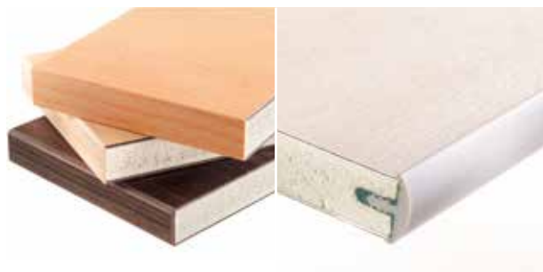
Laminiert mit HPL, versiegelt mit flacher ABS Kante