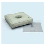
Bodenplatte mit Rotator und Wassergewicht 50 l 55x55 cm Gewicht: 19,7 kg