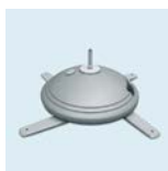
Wasserbefüllbarer Fuß mit Rotator Durchmesser: 60 cm Leergewicht: 2,2 kg Füllmenge: 9 l Wasser