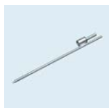
Erdspieß mit Rotator Länge: 60 cm Durchmesser: 12 mm