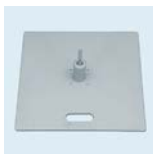
Bodenplatte mit Rotator 55x55 cm Gewicht: 19,7 kg