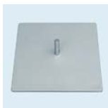
Bodenplatte 30x30 cm Gewicht: 4,3 kg