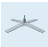
Kreuzfuß mit Rotator Durchmesser: 100 cm Gewicht: 17 kg