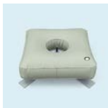
Kreuzfuß mit Rotator und Wassergewicht 50 l Durchmesser: 100 cm Gewicht: 17 kg