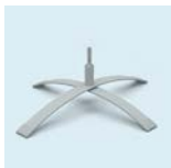
Kreuzfuß mit Rotator Durchmesser: 80 cm Gewicht: 4,3 kg