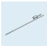
Erdspieß mit Rotator Länge: 60 cm Durchmesser: 12 mm