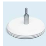
Betonfuß mit Rotator Durchmesser: 45 cm Gewicht: 20 kg