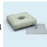
Bodenplatte mit Rotator und Wassergewicht 50 l 55x55 cm Gewicht: 19,7 kg