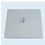
Bodenplatte 40x40 cm Gewicht: 9 kg