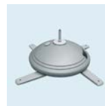
Wasserbefüllbarer Fuß mit Rotator Durchmesser: 60 cm Leergewicht: 2,2 kg Füllmenge: 9 l Wasser