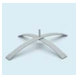
Kreuzfuß mit Dorn Durchmesser: 80 cm Gewicht: 4,5 kg